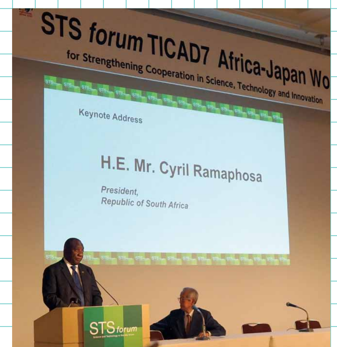
STSフォーラムセッションで 講演するラマポーザ大統領