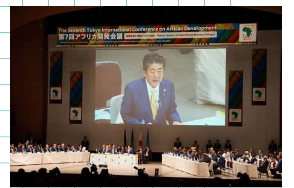
7回目の会合は 2019年8月に 横浜にて開催された