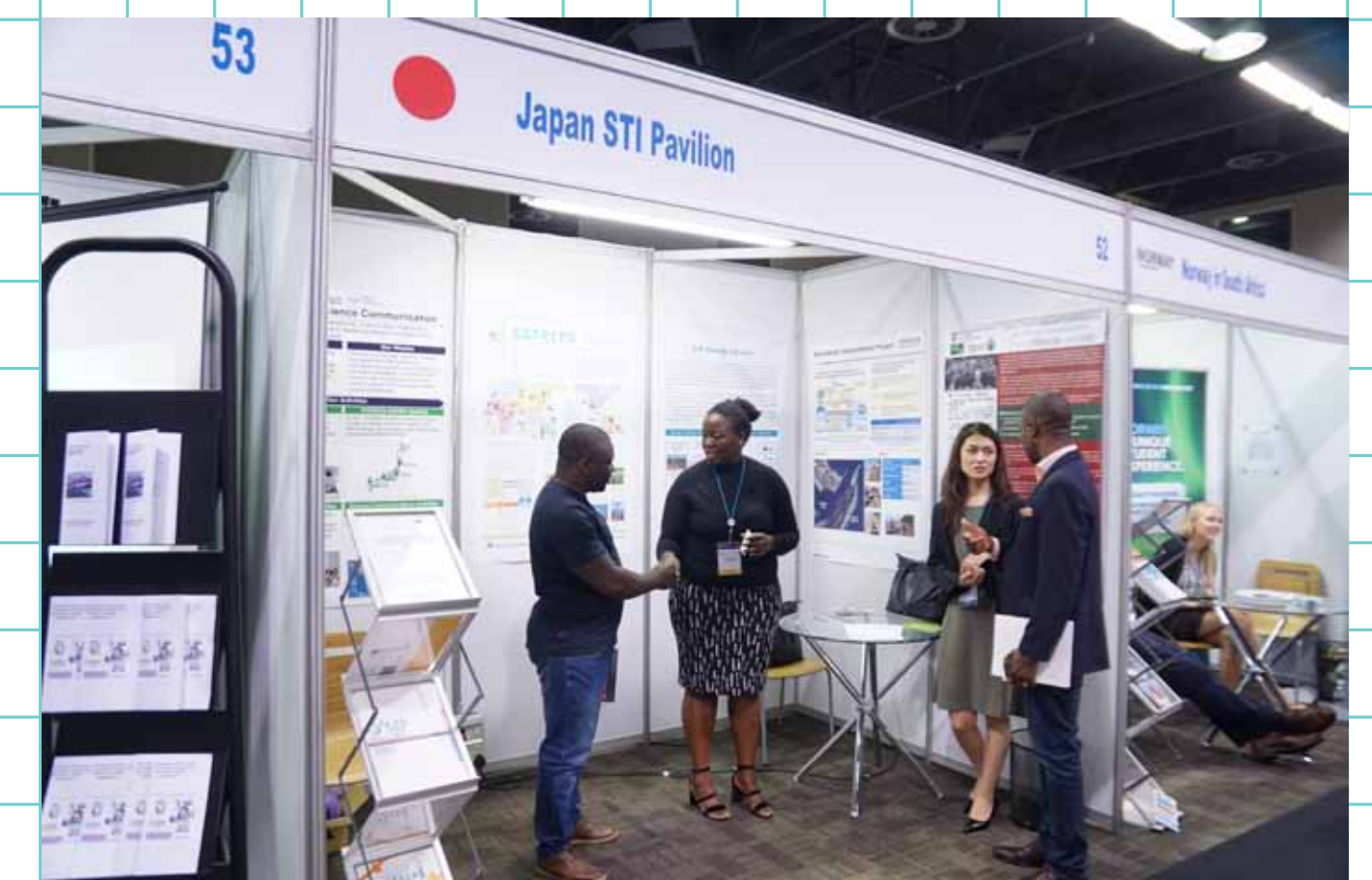
日本の科学技術の紹介ブース