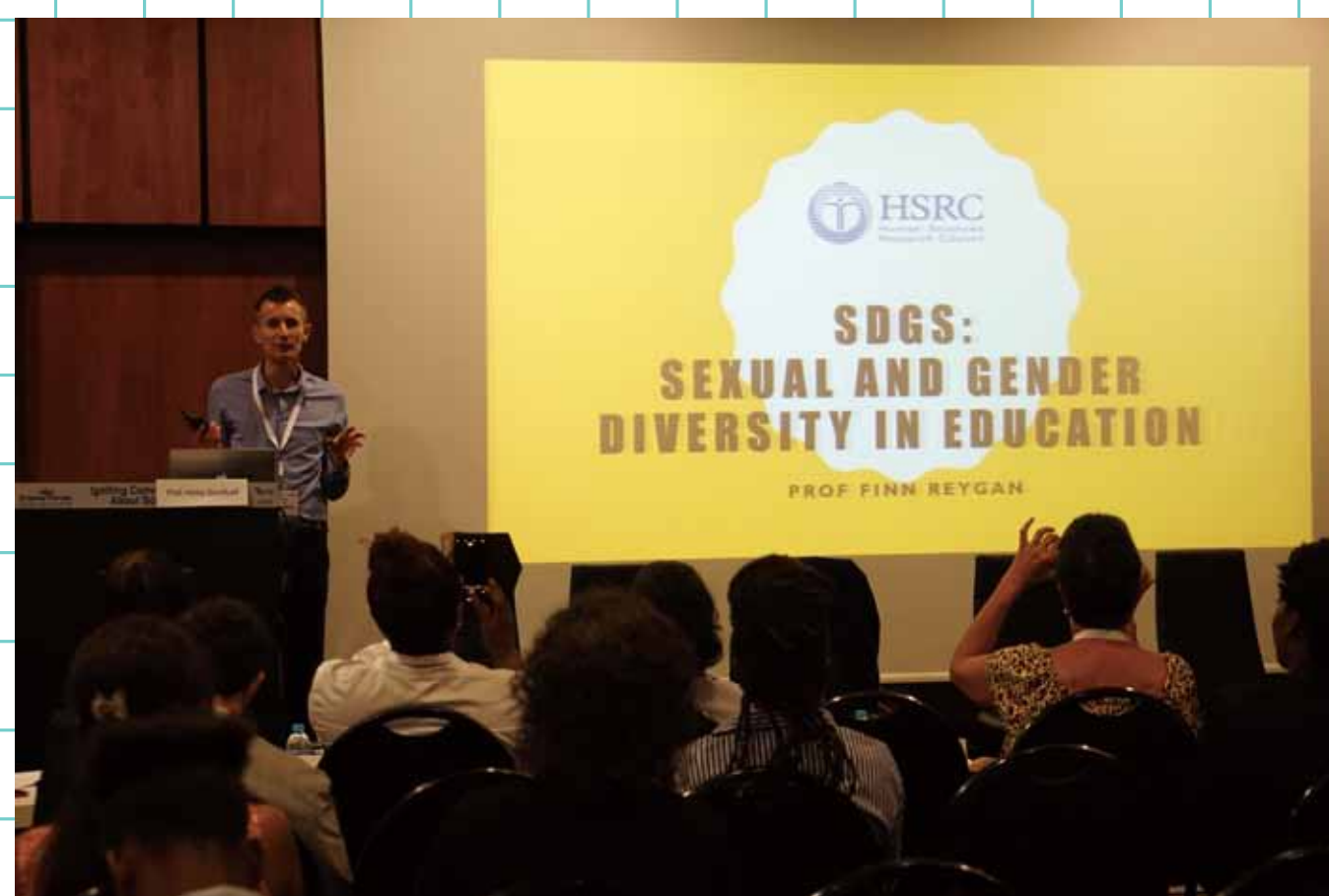
性的指向性について語る研究者